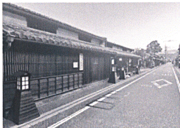
写真2 城東街並み保存地区

津山城は「日本100名城」「日本さくら名所100選」にも選ばれている津山市のシンボルです。城跡は鶴山公園（津山市山下135）として整備されており、春には約1000本の桜が咲き誇り（写真1）、秋には紅葉のライトアップも行われ、多くの観光客が訪れる観光名所です。また近隣には、湯郷温泉や奥津温泉、蒜山高原などの観光スポットもあります。