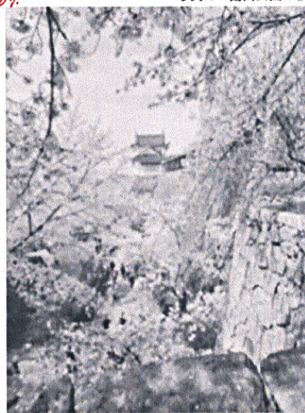
写真1 鶴山公園の桜

津山中央病院（以下、当院）は岡山県北東部に位置する基幹病院で、21の診療科を有する総合病院です。麻酔科は常勤9名、非常勤3名で、外科、整形外科、形成外科、泌尿器科、脳神経外科、手外科、心臓血管外科、産婦人科、眼科、歯科口腔外科の手術に対応しています。また手術麻酔に加えて、救急集中治療科と協力してICU管理や三次救急の患者対応、カテーテル治療や内視鏡などの鎮静、ペイン外来も担当しています。当院は岡山県北部で唯一の救命救急センターであり、緊急手術や外傷患者の手術も多く行われています。すべての麻酔科専門医経験症例を含めたさまざまな症例を経験することができ、専攻医にはもってこいの環境といえます。